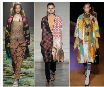
PHOTO : De gauche à droite : Loewe, Junya Watanabe, Dries Van Noten