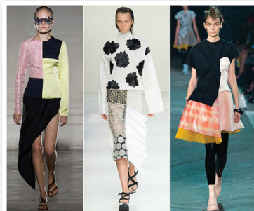
PHOTO : De gauche à droite : Dries Van Noten, Maison Martin Margiela, Prada. Une tendance vue aussi chez Saint Laurent, Stella McCartney...